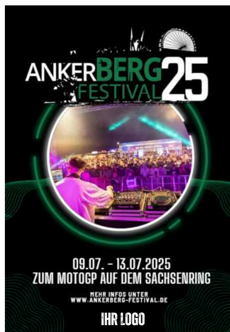
Instagram - Story